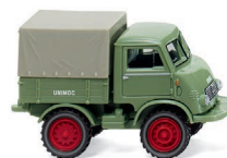
0368 02 Unimog U 401 UVP 17,49 €