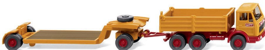
0492 01 Tiefdehängerzug (MB NG) UVP 18,99 €