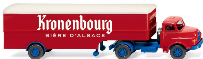
0513 22 Koffersattelzug (Saviem) UVP 19,99 €