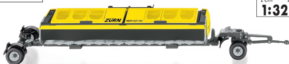
0778 38 Zürn Direktschneidwerk Profi Cut 700 mit Wagen UVP 74,95 €