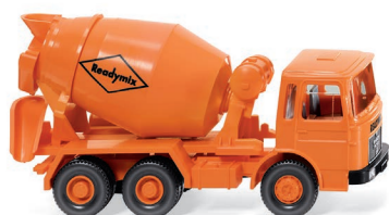
0682 04 Betonmischer (MAN) UVP 13,49 €