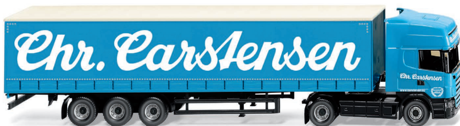
0537 09 Gardinenplanensattelzug (Scania R420 Topline) UVP 29,99 €

Die facettenreiche Welt der Miniaturen aus sechs Jahrzehnten – WIKING hält sie lebendig! Das Froschauge debütiert mit Plane ebenso wie der VW T1 als Campingbus mit zeitgenössisch typischem Dachgepäckträger. Modellfreude bereitet das Tieflader-Gespann nach Bölling-Vorbild der 1980er-Jahre ebenso viel wie der Saviem-Koffersattelzug der Straßburger Brauerei