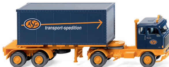
0526 02 Containersattelzug 20' (Volvo F89) UVP 21,49 €