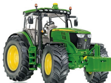
0778 36 John Deere 6250R UVP 79,95 €