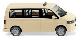
0308 08 Taxi – VW T5 GP Multivan UVP 15,49 €