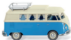
0797 33 VW T1 Campingbus UVP 15,49 €