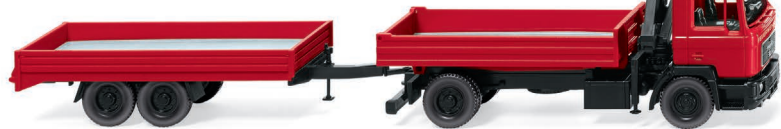
0601 30 Feuerwehr – Pritschenhängerzug (MAN F 90) UVP 24,99 €