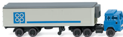
0951 99 Kühlkoffersattelzug (Magirus) N-Spur 1:160 UVP 8,99 €

A traktive Maßstabskontraste à la WIKING! Der Fendt 1050 Vario erscheint mit imposanten Zwillingreifen zugleich in 1:87 und 1:32 – augenfälliger kann Modellfaszination kaum sein. Wer den Präzisionsmaßstab 1:32 zu schätzen weiß, darf sich vom Claas Commandor 116 CS mit Getreidevorsatz C660 beeindrucken lassen. Der Mährescher gilt als großer Ernte-Youngtimer der 1990er-Jahre und erweitert bei WIKING das landwirtschaftliche Sortiment im Maßstab 1:32 durch eine Retrospektive. Selbstverständlich startet das neue Sammel-