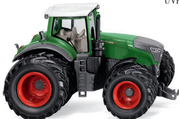
0361 62 Fendt 1050 Vario mit Zwillingreifen UVP 19,99 €