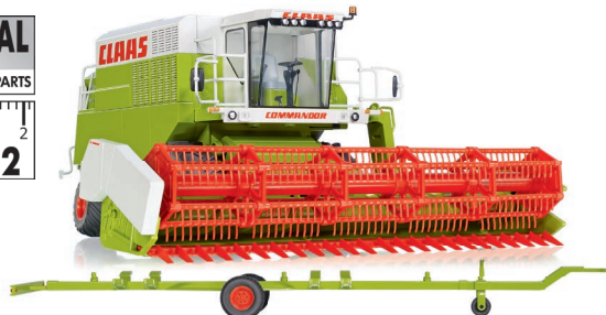
0778 34 Claas Mährescher Commandor 116 CS UVP 159,95 €