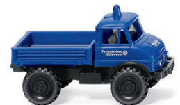
0693 29 THW – Unimog U 406 UVP 10,99 €