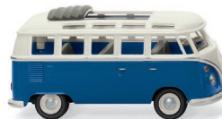
0797 21 VW T1 Sambabus UVP 16,49 €