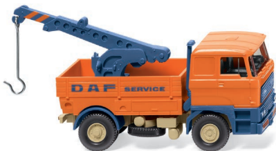
0634 04 Abschleppwagen (DAF) UVP 14,99 €