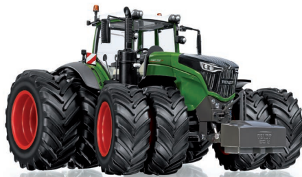
0778 30 Fendt 1050 Vario mit Zwillingreifen UVP 94,95 €