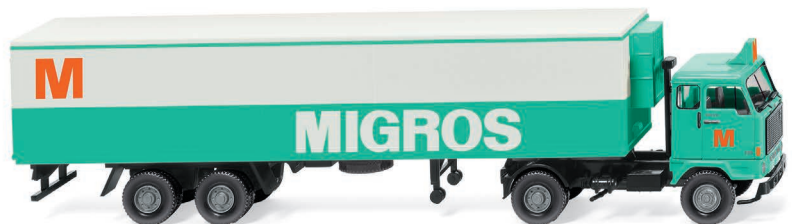
0543 01 Kühlkoffersattelzug (Volvo F89) UVP 23,49 €