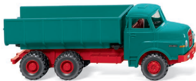
0645 02 Schuttwagen (MAN) UVP 14,99 €