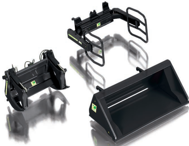
0773 85 Frontlader Werkzeuge - Set A · UVP 29,95 €